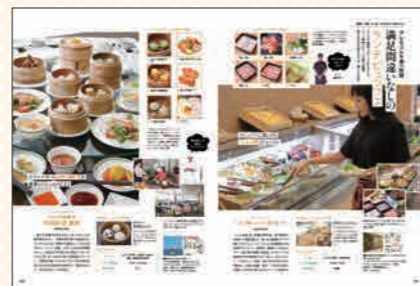
月刊にいがた2017年10月号