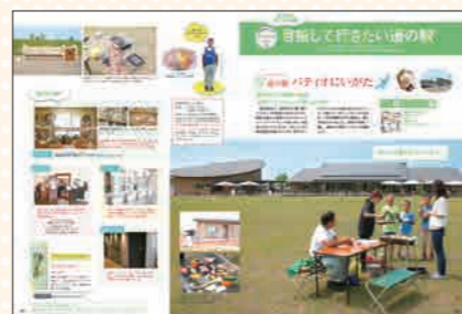
月刊にいがた2017年7月号