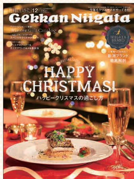
月刊にいがた2017年12月号